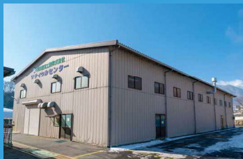
リサイクルセンター

ニッケルめっき水洗水を濃縮し、めっき液槽に戻す事により、めっき液に補填する薬品の量を低減。